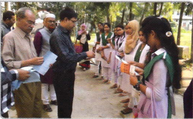
২৯ নভেম্বর ২০১৬ তারিখে জামালপুর জেলার সরকারি জাহেদা সফির মহিলা কলেজে, অধ্যক্ষের উপস্থিতিতে ছাত্রীদের মাঝে মাদকের কুফল সম্পর্কে আলোচনা করা হয় ও লিফলেট বিতরণ করা হয়।