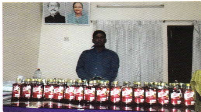
১০ নভেম্বর ২০১৬ তারিখে সিলেট জেলার ওসমানি নগর থানাধীন এলাকায় ১০০ বোতল অফিসার্স চয়েজ মদ সহ একজন আসামীকে শ্রেফতার করা হয়।

জেলা মাদকদ্রব্য নিয়ন্ত্রণ কার্যালয়, সিলেট “এ” সার্কেল কর্তৃক ১০০ বোতল অফিসার্স চয়েজ মদ উদ্ধার সহ একজন আসামী শ্রেফতার