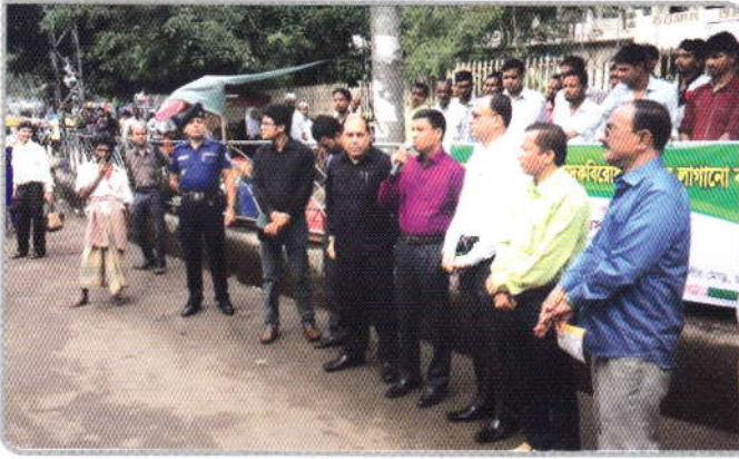
০৭ নভেম্বর ২০১৬ তারিখে দেশব্যাপী কর্মসূচির অংশ হিসেবে চট্টগ্রাম জেলা প্রশাসন ও মাদকদ্রব্য নিয়ন্ত্রণ কার্যালয়, চট্টগ্রামের উদ্যোগে গণপরিবহনে মাদকবিরোধী স্টিকার সংযোজন করা হয়।