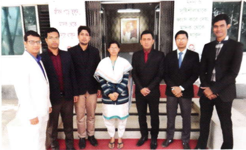
অধিদপ্তরে নব যোগদানকৃত ০৭ জন সহকারী পরিচালক

মাদকদ্রব্য নিয়ন্ত্রণ অধিদপ্তরে নন-ক্যাডার পদে নিয়োগ (বিশেষ) বিধিমালা ২০১০ এর বিধান অনুযায়ী ৩৪ তম বিসিএস এর লিখিত ও মৌখিক পরীক্ষায় উত্তীর্ণ কিন্তু পদস্বল্পতার কারণে ক্যাডার পদে সুপারিশকৃত নয় এরূপ নিম্নে উল্লিখিত ০৮ (আট) জন প্রার্থীকে মেধা ও প্রচলিত কোটা পদ্ধতি অনুসরণে স্বরাষ্ট্র মন্ত্রণালয়ের