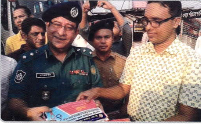
০৭ নভেম্বর ২০১৬ তারিখে জেলা মাদকদ্রব্য নিয়ন্ত্রণ কার্যালয়, রাজশাহী ও জেলা প্রশাসন, রাজশাহীর উদ্যোগে যানবাহনে মাদকবিরোধী স্টিকার লাগানো হয়।