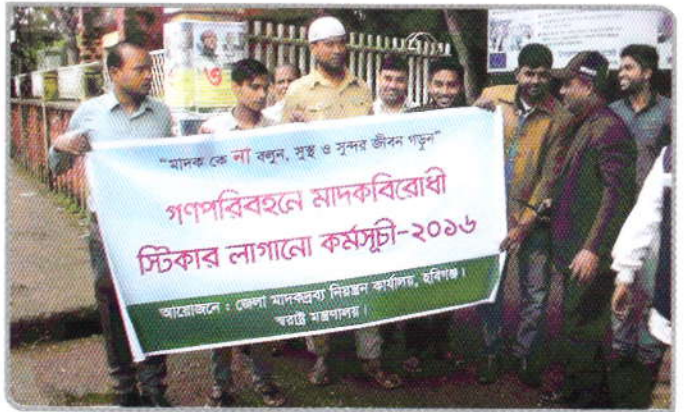
০৭ নভেম্বর ২০১৬ তারিখ জেলা মাদকদ্রব্য নিয়ন্ত্রণ কার্যালয় আয়োজিত "গণপরিবহনে স্টিকার সাটানো কর্মসূচী" উদ্বোধন করেন হবিগঞ্জ জেলার জেলা প্রশাসক। উপস্থিত ছিলেন অতিরিক্ত জেলা ম্যাজিস্ট্রেট, জেলা প্রশাসনের উর্ধ্বতন কর্মকর্তাবৃন্দ, বিআরটিএ হবিগঞ্জ এর সহকারী পরিচালক এবং মাদকদ্রব্য নিয়ন্ত্রণ অধিদপ্তরের কর্মকর্তা ও কর্মচারীগণ। উদ্বোধন শেষে জেলার বিভিন্ন স্থানে প্রায় ৪০০টি যানবাহনে দিনব্যাপী স্টিকার লাগানো হয়।