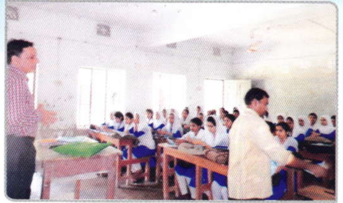
০১ নভেম্বর ২০১৬ তারিখে সরকারি গার্লস স্কুল, পটুয়াখালীর, ছাত্রীদের মাঝে মাদকের কুফল সম্পর্কে আলোচনা এবং মাদকবিরোধী লিফলেট বিতরণ করা হয়।