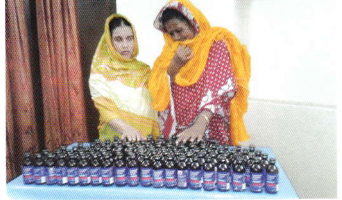
শ্রেফতারকৃত ০২ (দুই) জন মহিলা আসামী।

জেলা মাদকদ্রব্য নিয়ন্ত্রণ কার্যালয়, রাজবাড়ী কর্তৃক পশ্চিম ভবানীপুর উপজেলা থেকে ১০০ বোতল ফেন্সিডিল উদ্ধারসহ ০২ (দুই) জন মহিলা আসামী শ্রেফতার