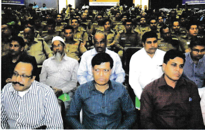
সমন্বয় সভায় উপস্থিত মাদকদ্রব্য নিয়ন্ত্রণ অধিদপ্তরের কর্মকর্তা ও কর্মচারীগণ

আস্থা অর্জন করা যায়। তিনি আরো বলেন যে, সম্মানিত সচিব মহোদয় যেসব মূল্যবান আদেশ, নির্দেশ ও পরামর্শ প্রদান করেছেন তা প্রতিপালন করলে অধিদপ্তরের সবাই দক্ষ হিসেবে গড়ে ওঠার পাশাপাশি অধিদপ্তর আরো কার্যকর ও অর্থবহ প্রতিষ্ঠান হিসেবে পরিণত হবে।