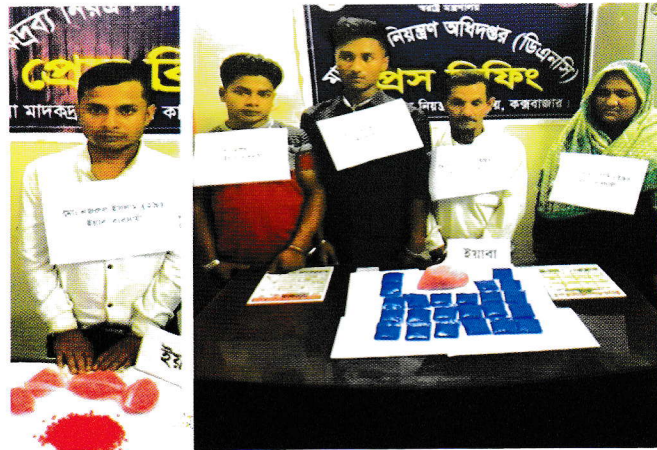
পৃথক অভিযানে ইয়াবাসহ আটক ৫

কক্সবাজারে জেলা মাদকদ্রব্য নিয়ন্ত্রণ কার্যালয়ের কর্মকর্তাগণ গোপন সংবাদের ভিত্তিতে অভিযান চালিয়ে ১২৪৪০ পিস ইয়াবাসহ ৫ জন মাদক ব্যবসায়ীকে আটক করেছেন।