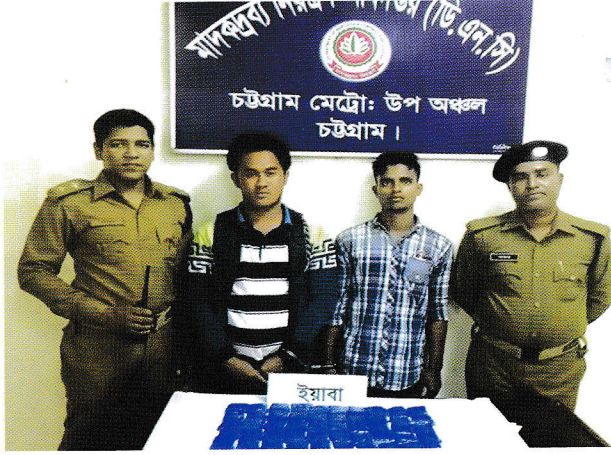
পৃথক অভিযানে ১৩ হাজার ২০০ পিস ইয়াবাসহ আটক আসামী

গত ৫ ফেব্রুয়ারি ২০১৮ তারিখে চট্টগ্রাম নগরীর কোতোয়ালী থানা এলাকায় পৃথক অভিযান পরিচালনা করে ১৩২০০ পিস ইয়াবা ট্যাবলেটসহ চার মাদক পাচারকারীকে গ্রেফতার করেছেন মাদকদ্রব্য নিয়ন্ত্রণ অধিদপ্তরের চট্টগ্রাম মেট্রো উপঅঞ্চলের কর্মকর্তাগণ।