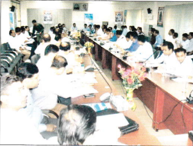
১ম ত্রৈমাসিক সমন্বয় সভায় উপস্থিত অধিদপ্তরের কর্মকর্তাবৃন্দ