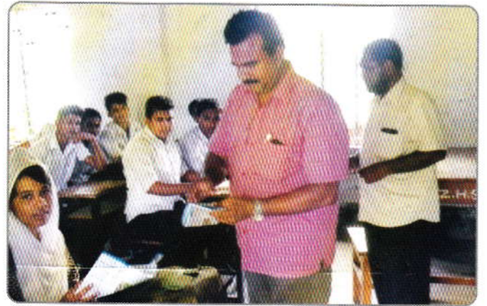
গত ৩১ মে ২০১৬ তারিখ খালিশপুর জিয়া মাধ্যমিক বিদ্যালয়, খুলনা ছাত্র-ছাত্রীদের মাঝে মাদকের কুফল সম্পর্কে আলোচনা ও মাদকবিরোধী লিফলেট বিতরণ করেন জেলা মাদকদ্রব্য নিয়ন্ত্রণ অফিস, খুলনা "খ" সার্কেল এর কর্মকর্তাবৃন্দ