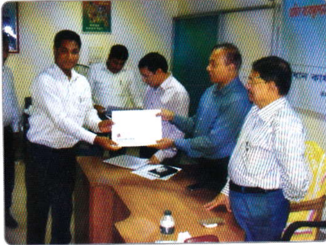
প্রশিক্ষণ শেষে প্রশিক্ষণার্থীদের মাঝে সনদপত্র বিতরণ করেন মহাপরিচালক মহোদয়