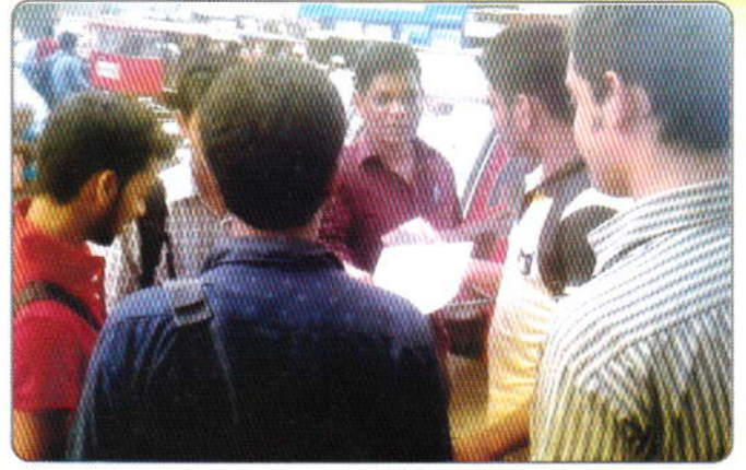
গত ১৭ মে ২০১৬ তারিখ পোস্ট অফিস মোড়, বিনাইদহ, সাধারণ জনগণ ও ছাত্রদের মাঝে মাদকবিরোধী পথসভা ও মাদকবিরোধী লিফলেট বিতরণ করেন মাদকদ্রব্য নিয়ন্ত্রণ অধিদপ্তরের কর্মচারীগণ