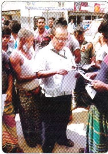
গত ০৩ মে ২০১৬ তারিখ কোমরগঞ্জ বাজার, নবাবগঞ্জ, ঢাকা, সাধারণ জনগণের মাঝে মাদকবিরোধী পথসভা ও মাদকবিরোধী লিফলেট বিতরণ করেন মাদকদ্রব্য নিয়ন্ত্রণ অধিদপ্তরের কর্মচারীগণ