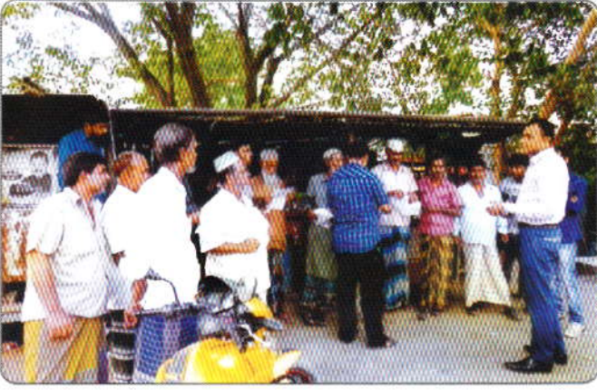
গত ২৫ মে ২০১৬ তারিখ পাকুটিয়া বাজার, ঘাটাইল, টাঙ্গাইল সাধারণ জনগণের মাঝে মাদকবিরোধী পথসভা ও মাদকবিরোধী লিফলেট বিতরণ করেন মাদকদ্রব্য নিয়ন্ত্রণ অধিদপ্তরের কর্মচারীগণ