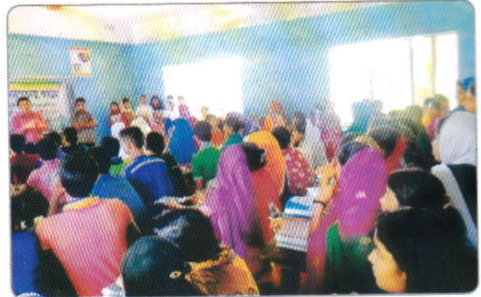
গত ০৭ মে ২০১৬ তারিখ পশ্চিম আউলিয়াপুর আদর্শ মাধ্যমিক বিদ্যালয়, পটুয়াখালী ছাত্র-ছাত্রীদের মাঝে মাদকের কুফল সম্পর্কে আলোচনা ও মাদকবিরোধী লিফলেট বিতরণ করেন জেলা মাদকদ্রব্য নিয়ন্ত্রণ অফিস, পটুয়াখালী এর পরিদর্শক

মে/২০১৬ মাসে শিক্ষাপ্রতিষ্ঠানে শ্রেণী বক্তৃতা হয়েছে ১৩৪ টি স্থানে। ঢাকা, খুলনা, ফরিদপুর ও বিনাইদহ জেলার আলোচনা অনুষ্ঠানের কয়েকটি সংবাদচিত্র :