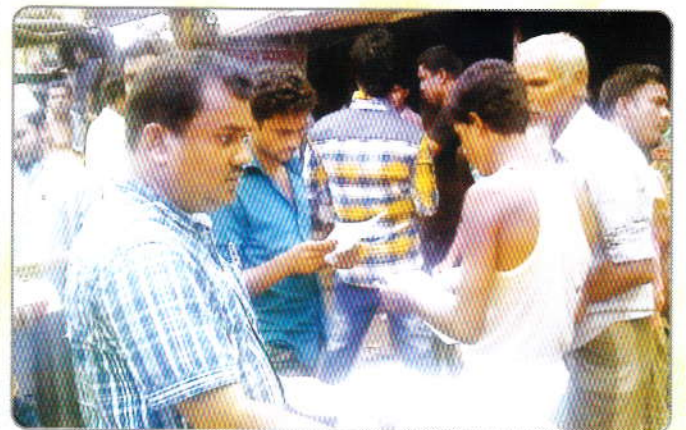
গত ১৭ মে ২০১৬ তারিখ জামগড়া চৌরাস্তা, আশুলিয়া, ঢাকা, সাধারণ জনগণের মাঝে মাদকবিরোধী পথসভা ও মাদকবিরোধী লিফলেট বিতরণ করেন মাদকদ্রব্য নিয়ন্ত্রণ অধিদপ্তরের কর্মচারীগণ