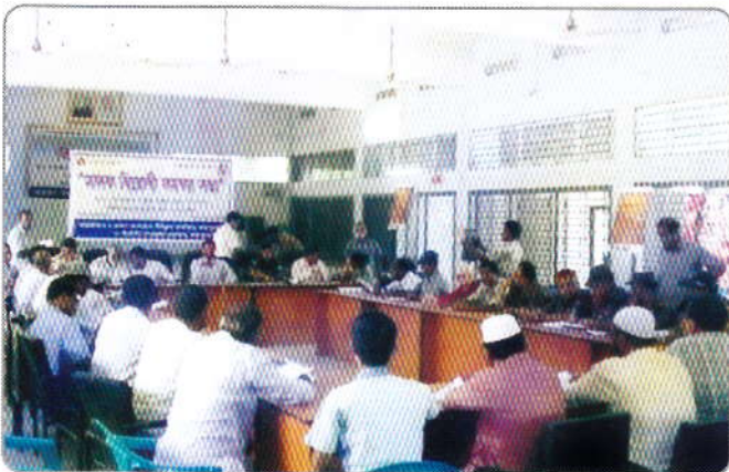
গত ৩১ মে ২০১৬ তারিখ উপজেলা পরিষদ মিলনায়তন, পাঁচবিবি, জয়পুরহাটে মাদকবিরোধী সমন্বয় সভা অনুষ্ঠিত হয়, এই অনুষ্ঠানের আয়োজন করেন জেলা মাদকদ্রব্য নিয়ন্ত্রণ কার্যালয়, জয়পুরহাট ও পাঁচবিবি উপজেলা প্রশাসন, জয়পুরহাট